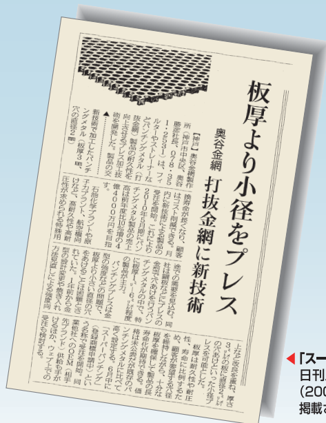
◀「スーパーパンチング」が、日刊工業新聞(2009年6月12日)に掲載されました。